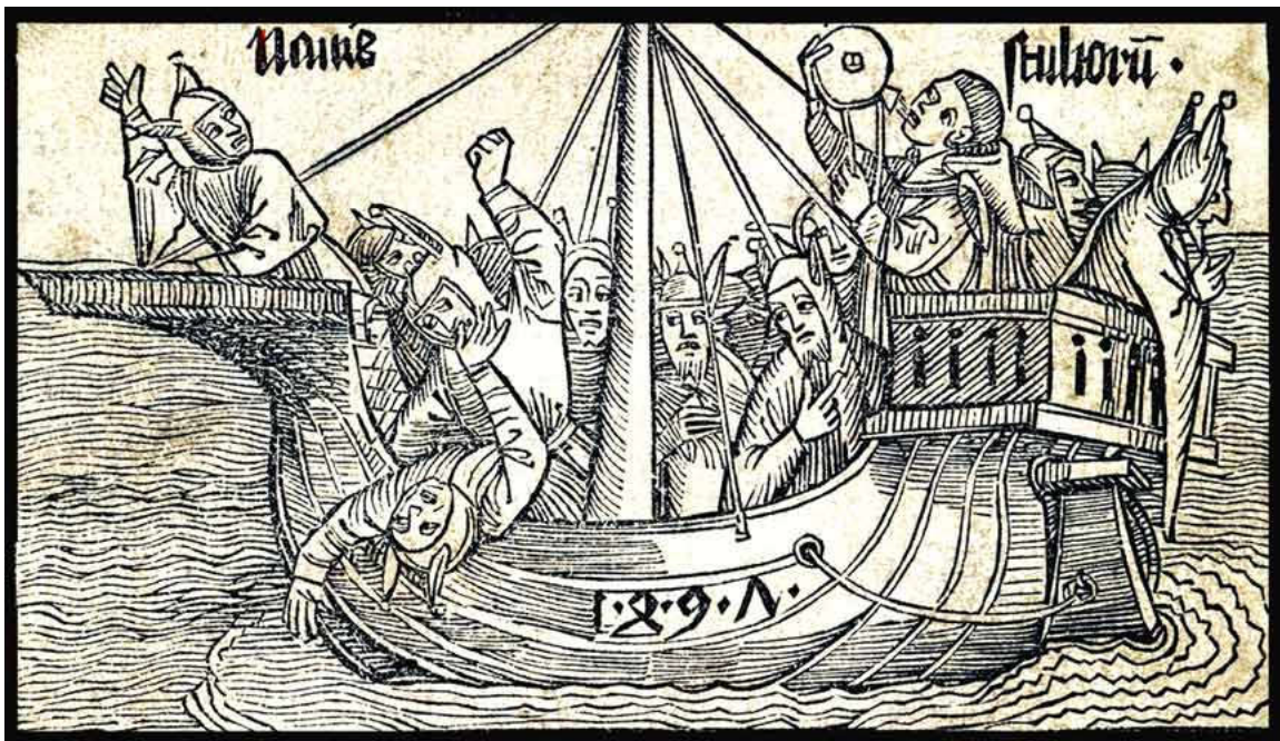
Figura 1. La nave de los locos, en la ilustración del libro de Sebastian Brandt (1494).

Foucault, Historia de la locura en la época clásica